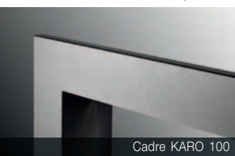
Cadre KARO 100