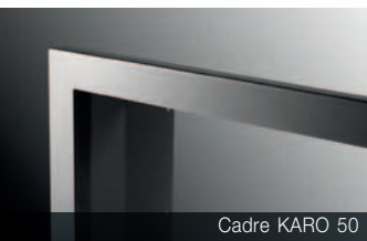
Cadre KARO 50