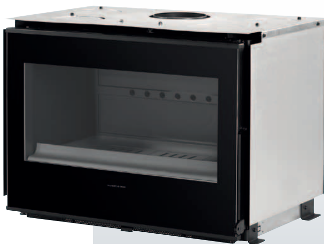
800 HORIZON FV