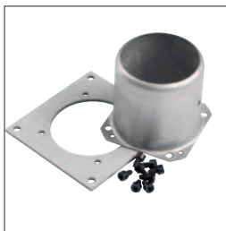
Buse de raccordement d'air Ø 75 mm