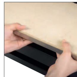
Défecteur inox doublé vermiculite amovible sans outil