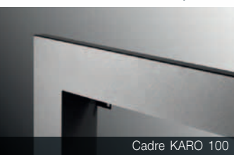
Cadre KARO 100