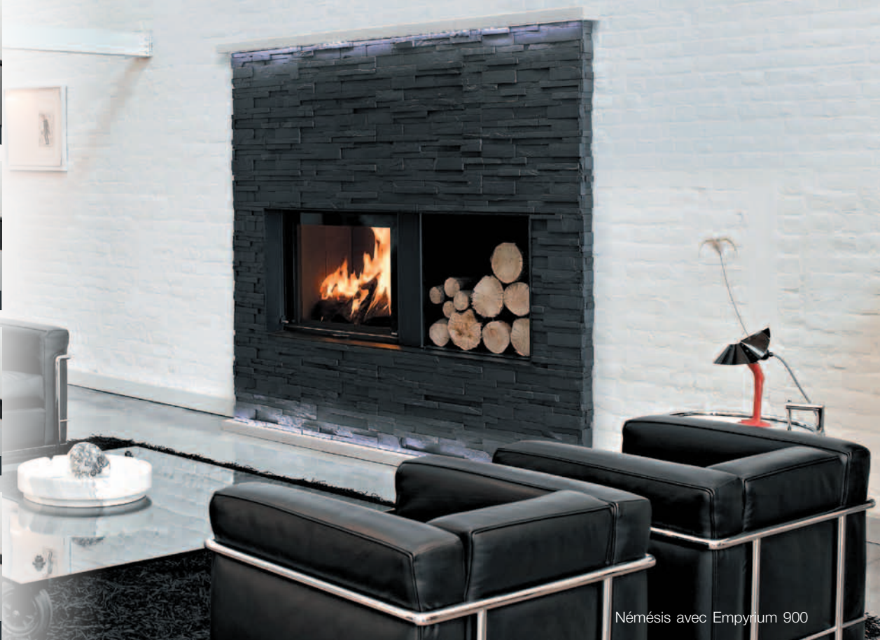
Némésis avec Empyrium 900