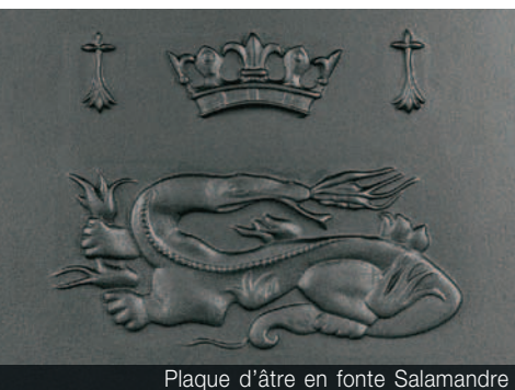
Plaque d'âtre en fonte Salamandre