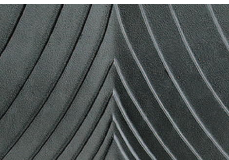
Plaque d'âtre en fonte décor style