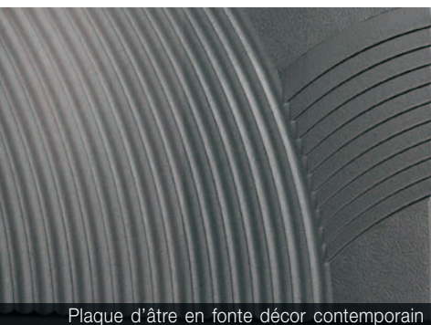
Plaque d'âtre en fonte décor contemporain