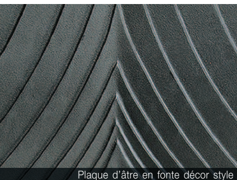
Plaque d'âtre en fonte décor style

Vision latérale du feu pour une installation en angle