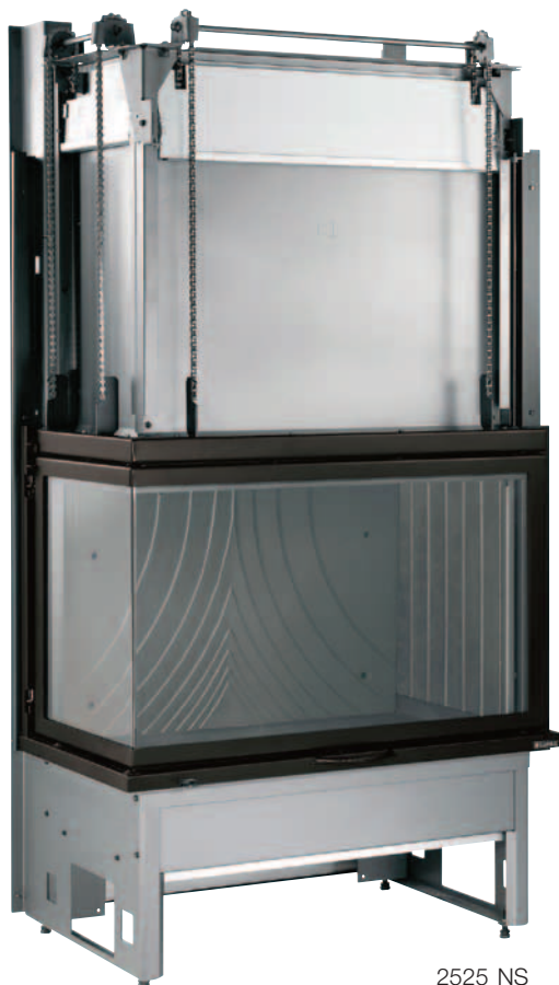
2525 NS Bi-vision gauche