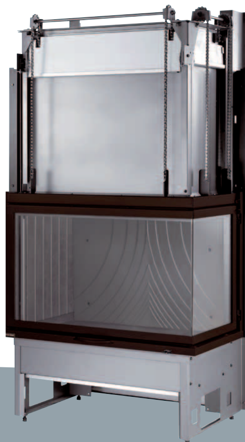
2527 NS Bi-vision droit

Vision latérale du feu pour une installation en angle